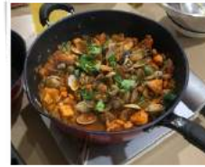
あざりと豚肉の蒸し煮