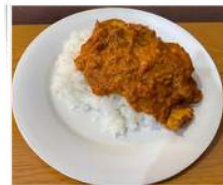
チキンティッカマサラ