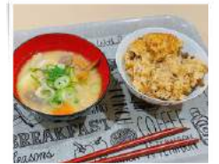
きのこの炊き込みご飯 とん汁