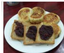
おやき風あんぱん